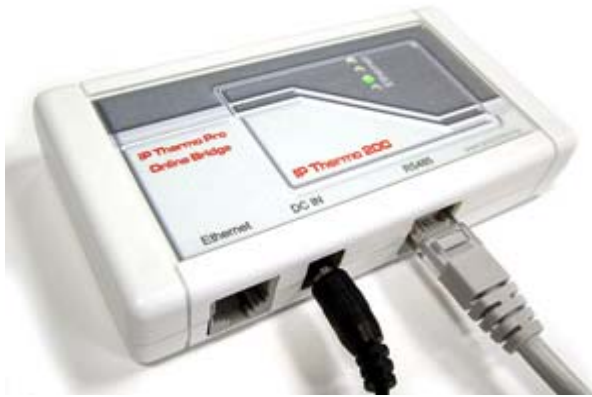
IP Thermo 200-E4 (RS485 / Ethernet)

Online adattovábbító eszköz IPThermo Pro szériához saját, programozható IP címmel